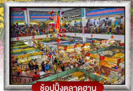
ซ้อปั้งตลาดฮาน