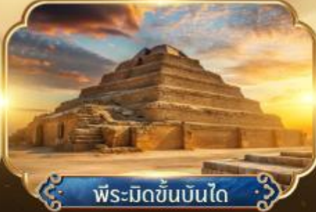
พีระมิดขั้นบันได

เริ่มต้น 48,900.- ★ ตั๋วเครื่องบินมหาสฟิงซ์และ พีระมิดแห่งกิซ่า ★ ชมพิพิธภัณฑ์แกรนด์อียิปต์ GEM