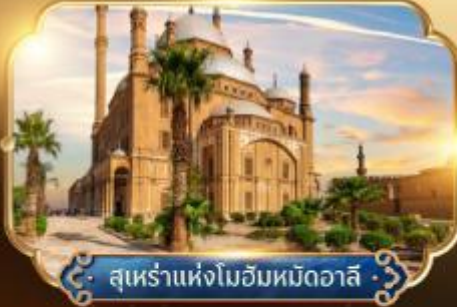
สุเหร่าแห่งโมฮัมหมัดอาลี