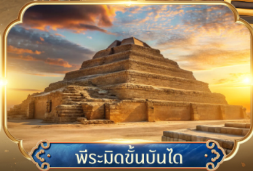
พีระมิดขั้นบันได