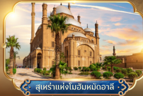
สุเหร่าแห่งโมฮัมหมัดอาลี