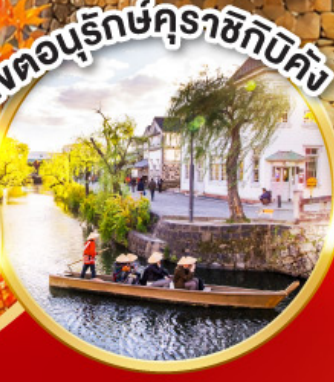
เวตอนุรักษณ์คุราชิกิบิคัง