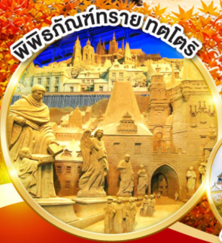
พิพิธภัณฑ์รายกตไตร