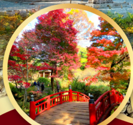
สวนดอกบ๊วยอาตามิ