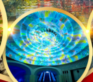
พิพิธภัณฑ์ศิลปะ MOA