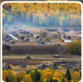
หมู่บ้านเหมู่

สวรรค์ใบไม้เปลี่ยนสี เยือนคานาสี้อแดนฝัน มหัศจรรย์หมู่บ้านเหมู่ เคนเคอทัวให้อัจฉริยะภูพาน