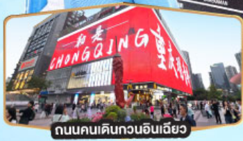
ถนนคนเดินทงวนฉิงเฉียว