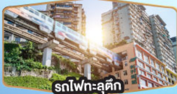
รถไฟฟ้าสุดคึก