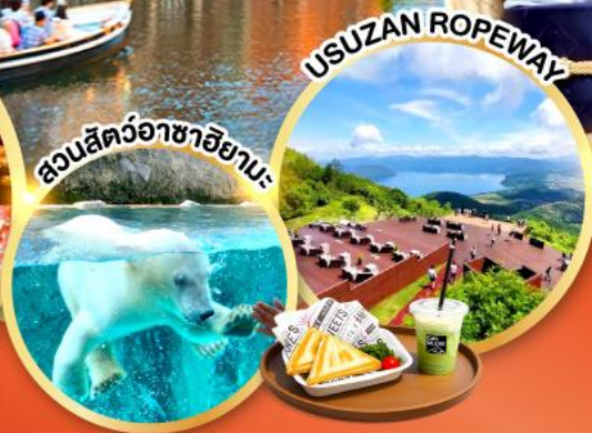
สวนสัตว์อาซาฮิยามะ