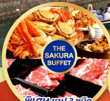
พิเศษข่าปู 3 ชนิด (ปูทะเล+ปูไข่+ปูขน)