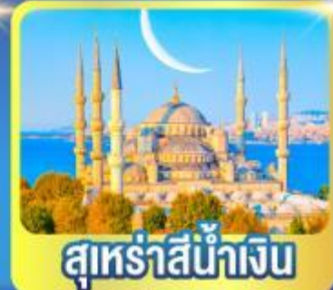
สุร่ายน้ำเงิน