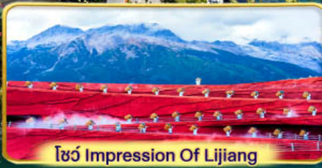
โชว์ Impression Of Lijiang