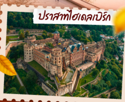
ปราสาทฮาเดเคบิร์ก