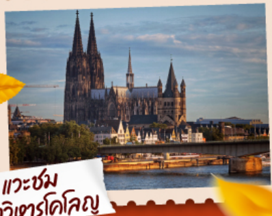
แวะชม มหาวิหารโคโลญ