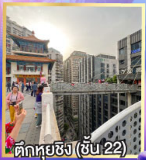
ตึกหุ่ยซิง (ชั้น 22)