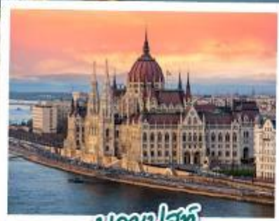
บรูตาปส์ตี