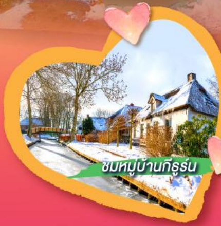
ชมหมู่บ้านกิธูร