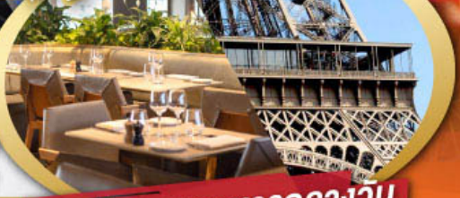
รับประทานอาหารกลางวัน บนหอคอยเฟล

ไฮไลท์ในโปรแกรม • ถ่ายรูปหอคอยเฟลและพิพิธภัณฑ์ลูฟว์ • สะพานไม้ชาเปล ลูเซิร์น • ขึ้นกระเช้าสู่ยอดเขาจุงเฟรา • เมืองมรดกโลก กรุงเบิร์น • ถ่ายรูปปราสาทซิลยงที่ม็องเทรอซ์ • ศาลาไทย เมืองโลซานน์ • เดินเพลินๆ ณ เมืองเวเวย์