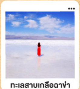
ทะเลสาบเกลือฉางซ่า