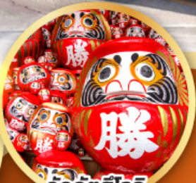
วัดคิตสึโองิ (วัดดามะ)

ชมความงามของกำแพงหิมะ เส้นทางสายอัลไพน์ ทากายามา (JAPAN ALPS SNOW WALL)