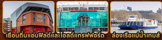
เยือนดินแอนฟิลด์และโอลด์แทรฟฟอร์ด | ล่องเรือแม่น้ำเทมส์

London Stonehenge Liverpool Manchester Stratford Upon Avon