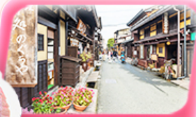
ทาคายามา