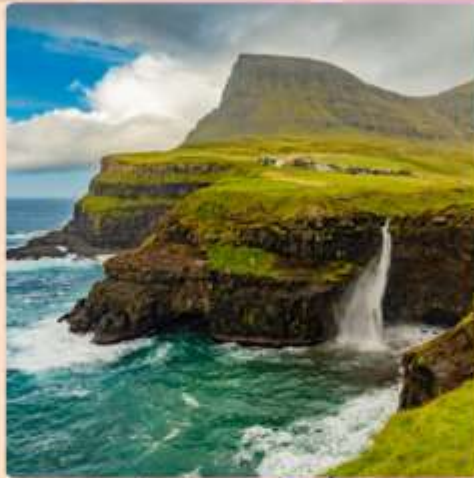
สัมผัสดินแดนไวคิงชม พระอาทิตย์เที่ยงคืน