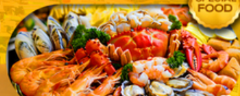
พิเศษเมนู ซิวัดบุฟเฟ่ต์ 1 มื้อ เดินทาง มีนาคม 2569