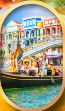
เอนิเมะแห่งเวียดนาม