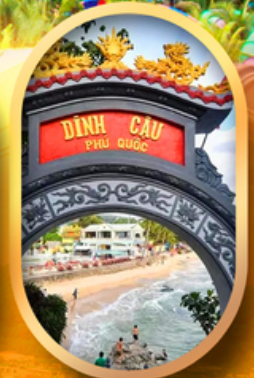
ศาลเจ้าติงเกา