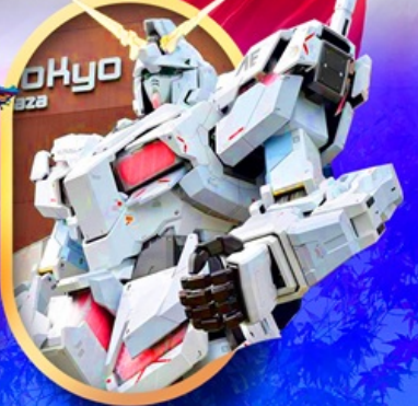
ห้างไอโดบะกันดั้ม