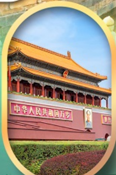
จัสมตรีสเทียนอันเหมิน