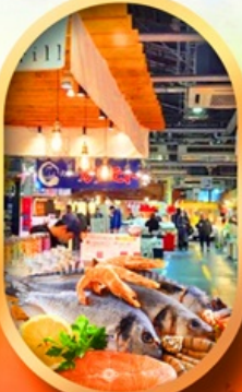
ตลาดปลาฮงโงไค