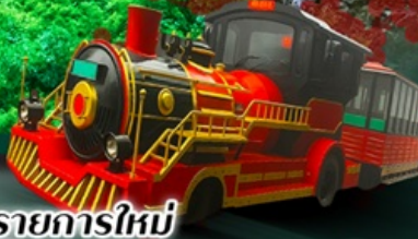
รายการใหม่

รวมภาษีน้ำมันเชื้อเพลิง และภาษีสนามบินแล้ว