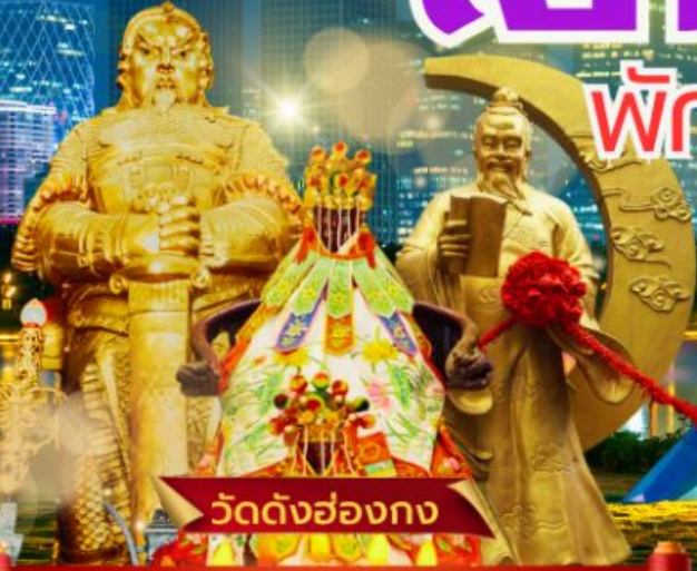
วัดดั่งฮ่องกง