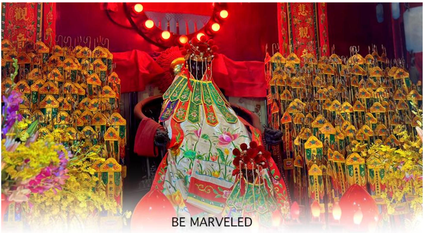
วัดเจ้าแม่กวนอิมฮวงอ้า (ฮิมเมิน)

ให้เดินทางกลับไปกราบไหว้ และขอบคุณเจ้าแม่กวนอิมอีกครั้ง โดยเตรียมชุดไหว้และกระดวยเงินกระดวยทองที่เป็นเหมือนเงินที่เรานำมาคืน เป็นการไหว้เพื่อคืนเงินเจ้าแม่กวนอิมนั่นเอง