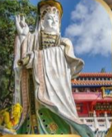
เจ้าแม่กวนอิม ริฟลิสเบย์