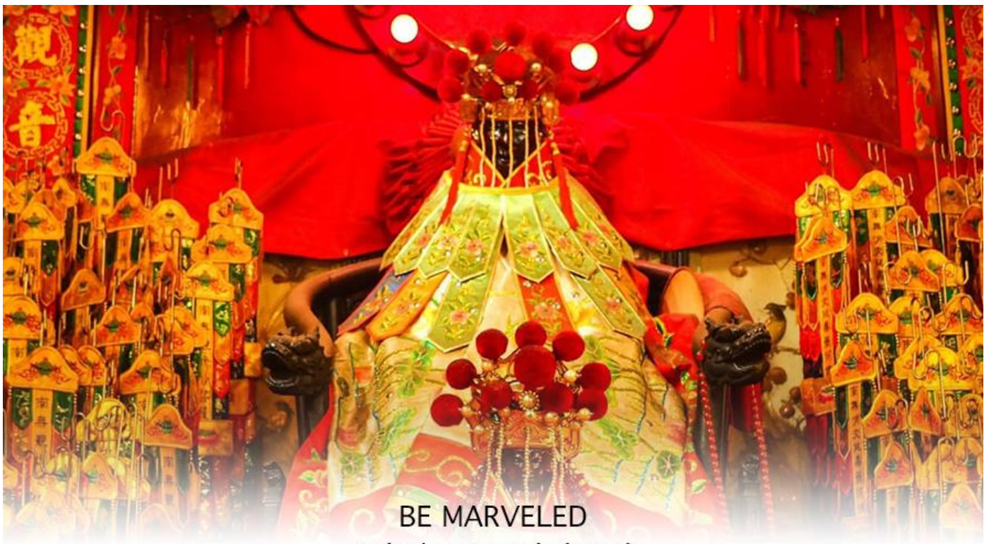
วัดเจ้าแม่กวนอิมสองห้า (ฮิมฮิน)

หลังจากนั้น นำทุกท่านเดินทางไปยัง (เจ้าแม่กวนอิม วัดสองห้า (HUNG HOM KWUN YUM TEMPLE) เป็นหนึ่งในวัดที่เก่าแก่ที่สุดของฮ่องกง และชาวฮ่องกงเลื่อมใสศรัทธามาก สร้างขึ้นในปี ค.ศ.1873 ในสมัยช่วงสงครามโลกครั้งที่ 2 มีการปล่อยระเบิดลงบริเวณใกล้กับวัดแห่งนี้หลายต่อหลายครั้ง ทำให้มีผู้บาดเจ็บและล้มตายมากมาย แต่ชาวบ้านที่หนีเข้าไปหลบภัยในวัดนี้ก็กลับปลอดภัยอย่างปาฏิหาริย์ และตัววัดก็ไม่ได้ได้รับความเสียหายจากเหตุการณ์ทิ้งระเบิดที่น่าอัศจรรย์ ตามความเชื่อของคนจีนในฮ่องกง-มาเก๊า จะมี "วันเปิดทรัพย์" หรือ "พิธียืมเงิน เจ้าแม่กวนอิมฮ่องกง" เป็นวันที่จะมาขอพรและยืมเงินเจ้าแม่กวนอิมซึ่งนับจากหลังวันตรุษจีน ไป 26 วัน จะเป็นวันเปิดทรัพย์ที่จัดขึ้นในทุกๆปี พิธีนี้จะมีเพียงครั้งปีละครั้งเท่านั้น เป็นวันสำคัญอีกวันที่คนหลังไหลมาไหว้ขอพรอย่างไม่ขาดสาย