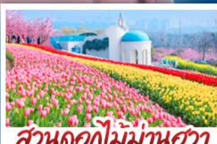
สวนดอกไม้บ้านฮวา