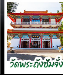
วัดพระถังซัมจั๋ง