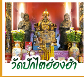
วัดบิกิตฮ้องฮ่า