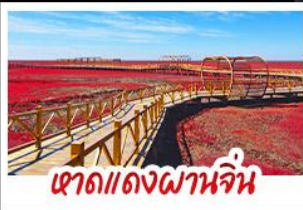
หาดแดงผานจีน