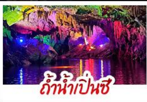
ถ้ำน้ำเป็นสี