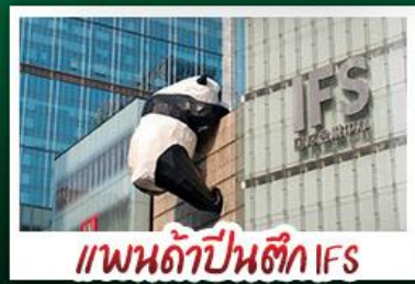
แพนด้าปิ่นตัก IFS