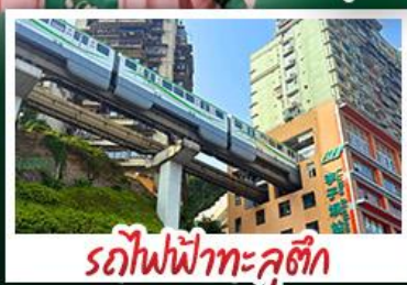
รถไฟฟ้าทะเลอู๋ตัก

2UCKG-FD014 | 6 วัน 4 คืน | AirAsia | โรงแรม 4 ดาว