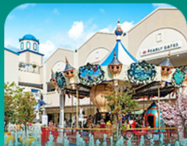
ลิตเติ้ลพัชร์เมียมอ้ากัฮึต