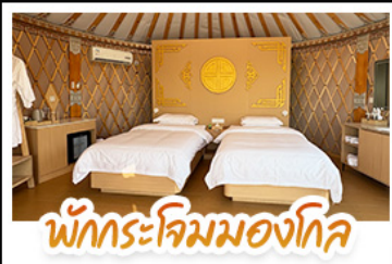
พักกระท่อมมองโกล