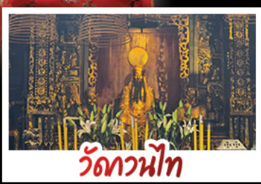
วัดกวนไท้