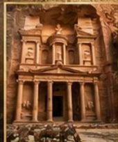
นครเพตรา