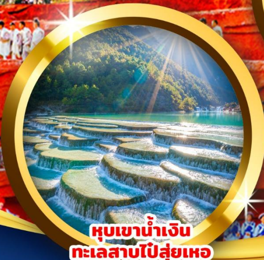
หุบเขาน้ำเงิน ทะเลสาบโป๋ส่วยเหอ