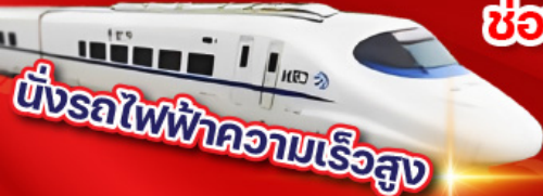
นั่งรถไฟฟ้าความเร็วสูง