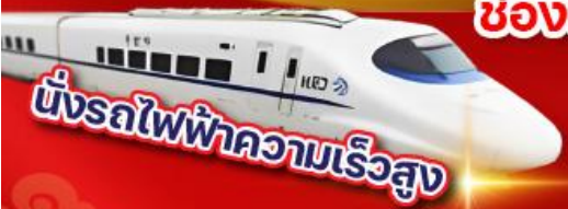
ขั้รถไฟฟ้าความเร็วสูง