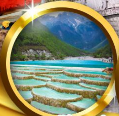
ทะเลสาบไ้สวยเห่อ