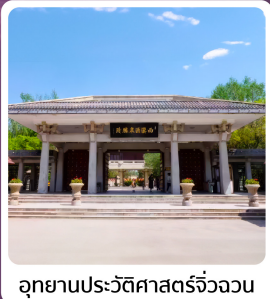
อุทยานประวัติศาสตร์จี้จวงวน