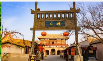
เมืองโบราณตุนหวง