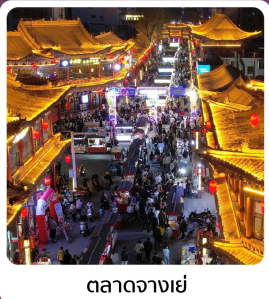
ตลาดจางเย่