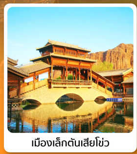
เมืองเล็กตันเสี่ยโซ่ว

อาหารมื้อพิเศษ ใต้ต้นหม้อไอน้ำ ซี่โครงหมูสัโตะลิกันโจว