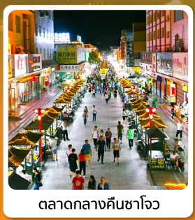
ตลาดกลางคิ่นซาโจว