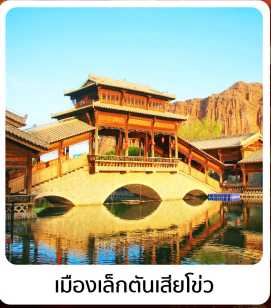
เมืองเล็กตันเสียว