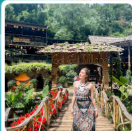
มุ้บ้านกั๊ต กั๊ต