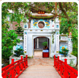
วัดหจ็อกเซิน

• โฮโล้กั พืชิตยอดเขาฟานซีปัน หลังคาแห่งอินโดจีน ลั้มพัสมุ้บ้านชาวเขา มุ้บ้านกั๊ต กั๊ต