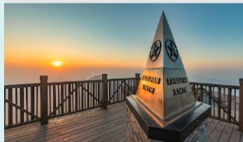
ฟานซิปิน