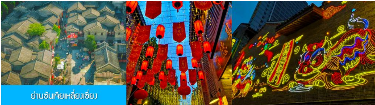
ย่านชุนเจียเหลียงเซียง