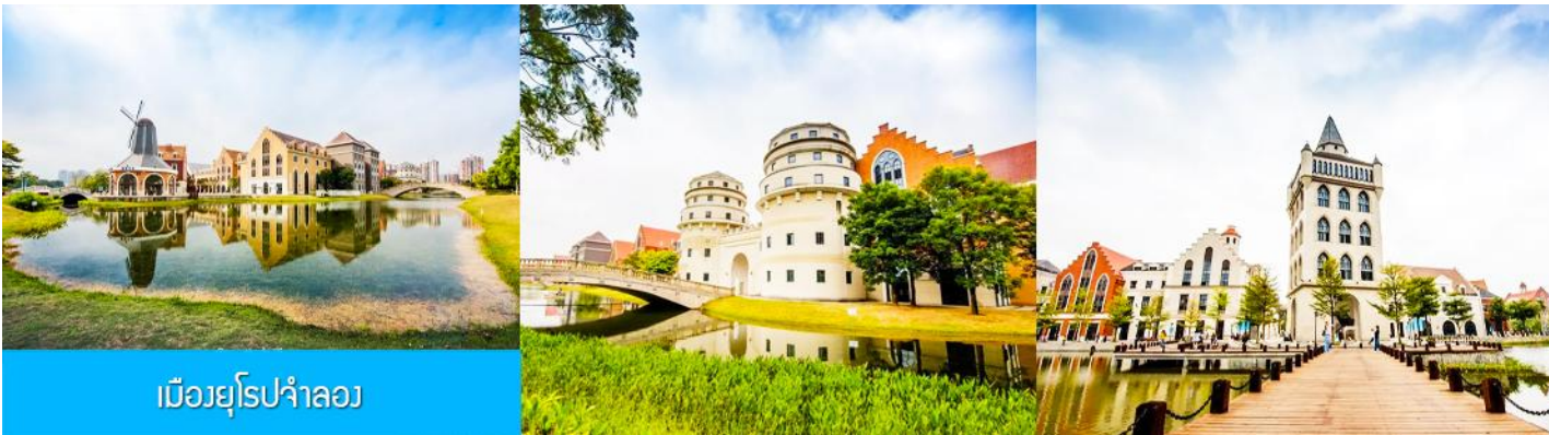
เมืองยุโรปจำลอง