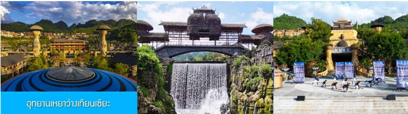
อุทยานเหวอว่างเทียนเซี่ยะ