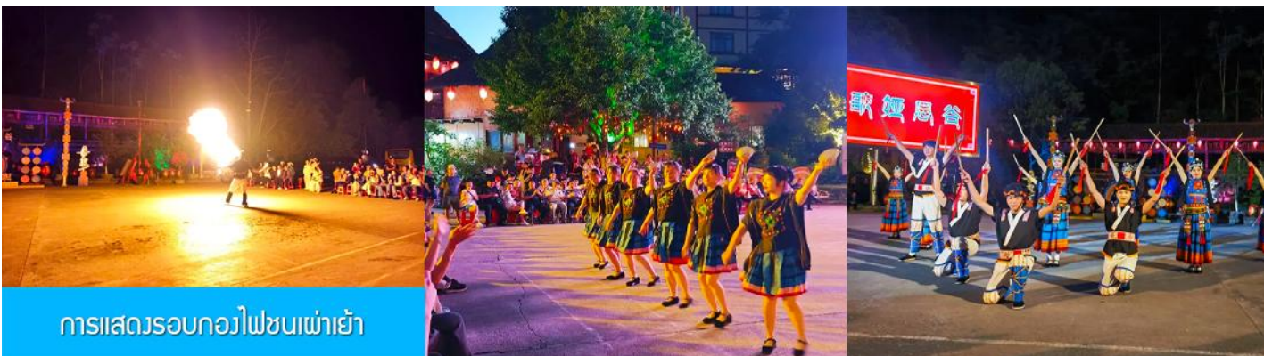
การแสดงรอบกองไฟชนเผ่าเย้า

หลังอาหารท่านสามารถชม การแสดงรอบกองไฟ 篝火表演 เป็นการแสดงพื้นเมืองของชนเผ่าเย้า (การแสดงรอบกองไฟจะงดจัดการแสดงในวันที่สภาพอากาศไม่เอื้ออำนวย) พักที่ NANDAN JINFUYAO HOTEL ระดับ 4 ดาวท้องถิ่นหรือเทียบเท่าในเมืองหนานตัน