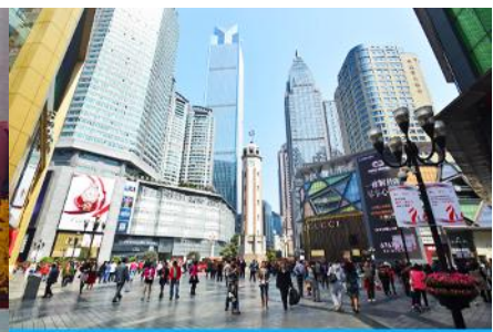
ย่านเจียฟ่างเปย