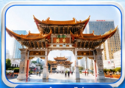
ประตูม้าทองโก่หยก