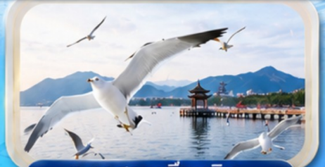
ทะเลสาบเตียนซิน