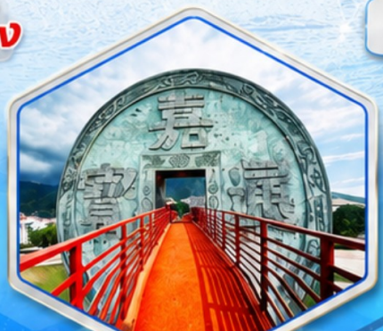
จตุรัสเหรียญโบราณ