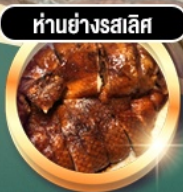
ห่านย่างสลีส