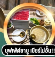
บุฟเฟ่ต์ชาบู เมื่อบริไม้อัน!!