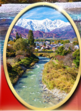
ไอโอดีพาร์ค