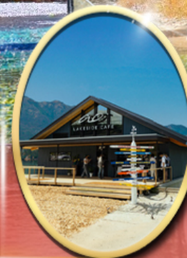
Ao Lakeside Cafe

34,919 ราคาเริ่มต้น บาท รวมภาษีมูลค่าเพิ่ม 7%