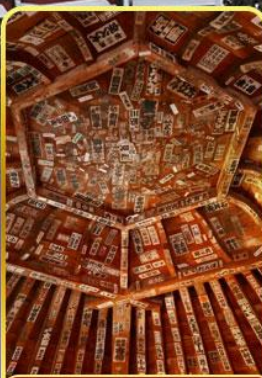
วัดซาชะเอโดะ