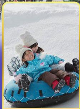
กิจกรรม ぬ ลานสกี