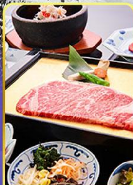
ROKKASEN ฟรีเมียม