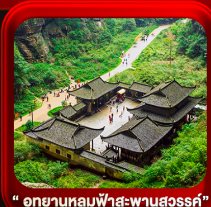
“ อุทยานหลุมฟ้าสะพานสวรรค์ ”