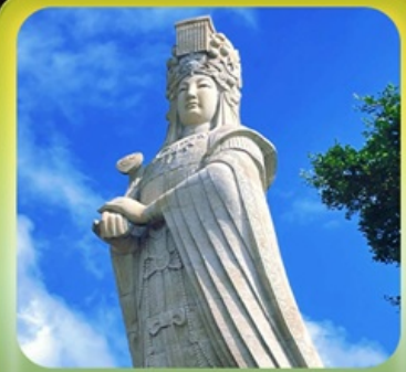
“เจ้าแม่กิมทิมหม่าโจ้ว”